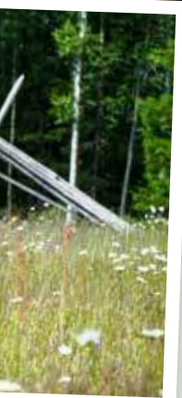
Granbergets fäbod, Leksand.