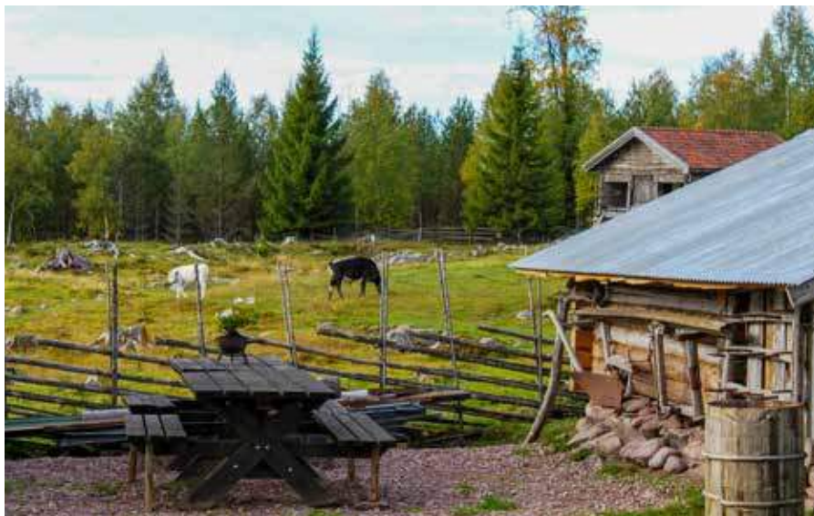
Kättboåsens fåbod.