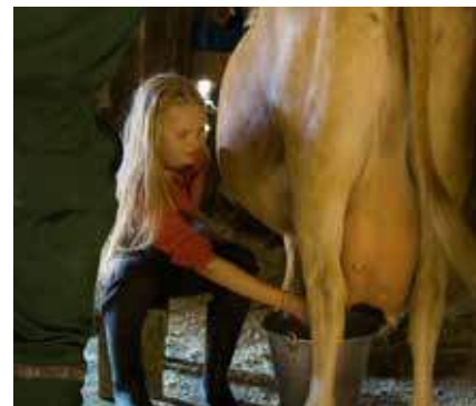
Skolbarn lär sig mjölka.

Historiskt sett var fäbodkullor/budeier de viktigaste utövarna av själva fäbodbruket och därför kan man framhäva fäbodkulturen som en viktig del i kvinnornas historia på landsbygden. Idag bor ofta hela familjen på fäboden och man hjälps åt. Vissa anlitar volontärer eller annan arbetskraft som bistår i skötseln av djuren, mjölkhantering, vård av byggnader och redskap, slätter av vinterfoder, transport av djur, mejeriprodukter och hö, och att ta hand om turister och andra gäster. Ingen av dessa uppgifter är bundna till någon specifik grupp.