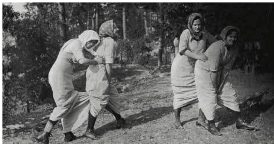
Flickor dansar "skäggloppa".