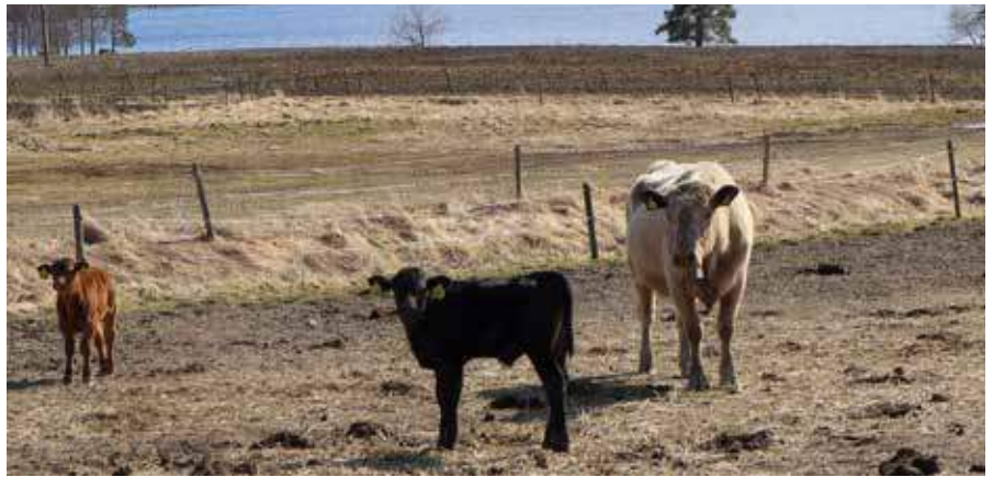
Hemma på gården i Tallåsen.

För att ha koll på var djuren är använder sig bröderna av Followit, ett GPS-system som skickar ut signaler varje timme. Men stambanan och trafikerade vägar skapar otrygghet som skulle kunna undvikas med ett system som prövats i Norge under flera år – Nofence. Nofence fungerar så att djurhållaren bestämmer var det digitala stängslet skall vara genom att antingen gå sträckan eller reglera den hemma på kammaren via en display. Djuren utrustas med ett halsband som känner av var gränsen går. Apparaten börjar ge ifrån sig en ljudsignal när djuret närmar sig gränsen för var det får beta. Ju närmare