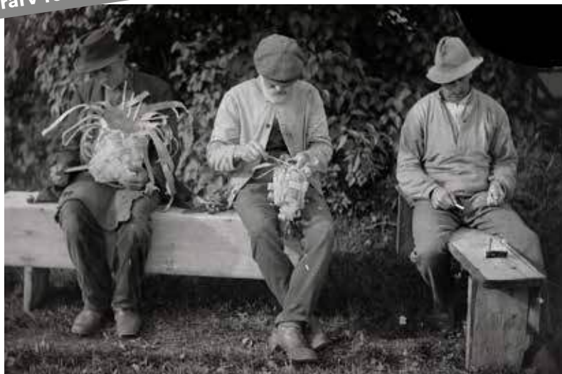
Tre män tvinnar metrev och flätar näverkorgar.