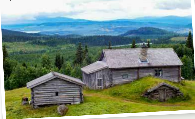
Myhrbodarna, Jämtland.