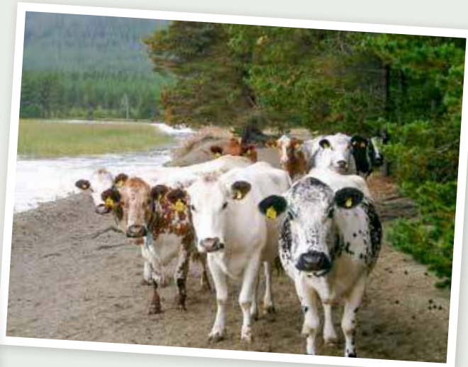
Klövsvjö, Jämtland.