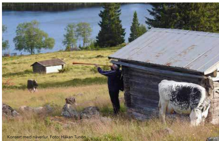
Konsert med näverlur.