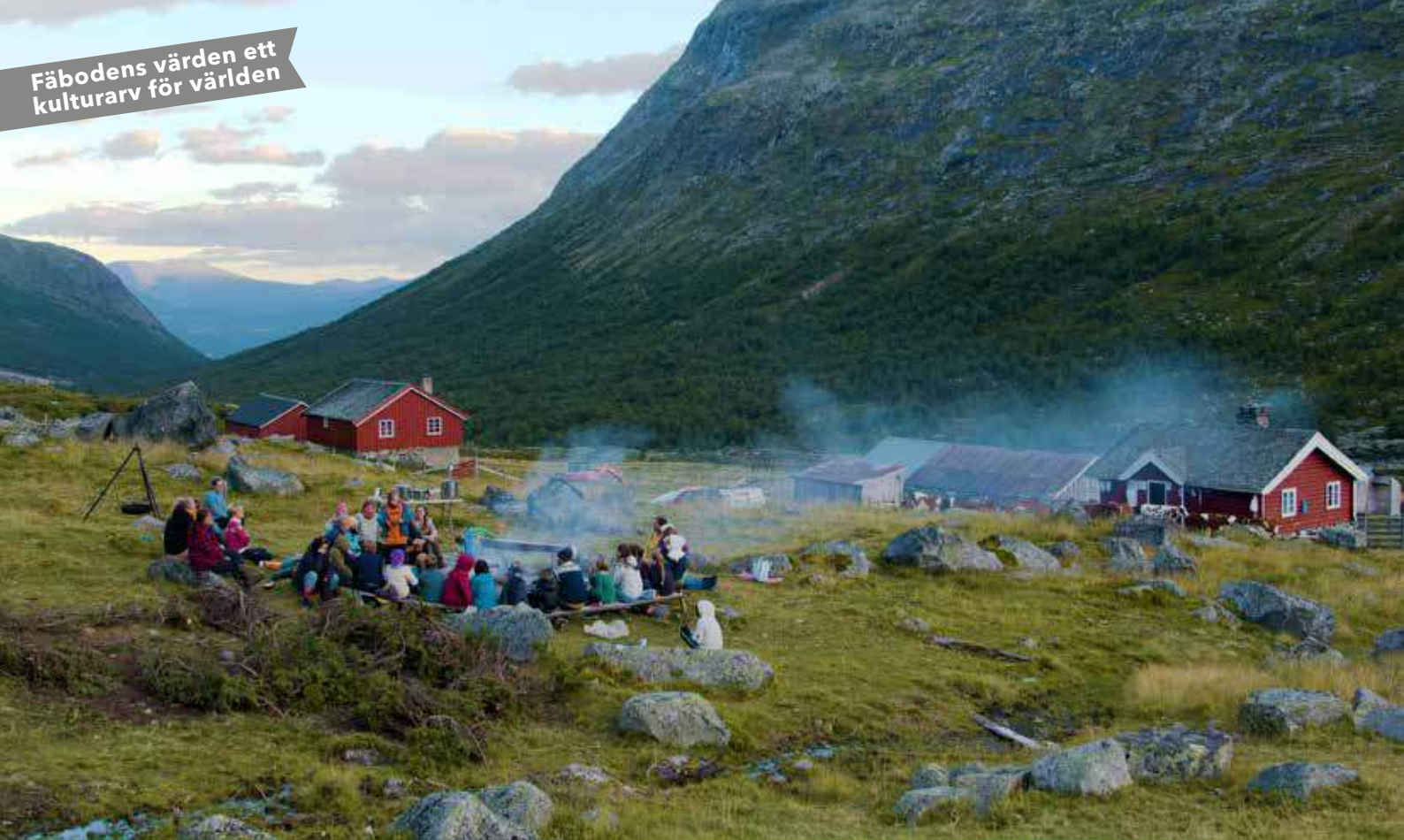
Besökare på setern.