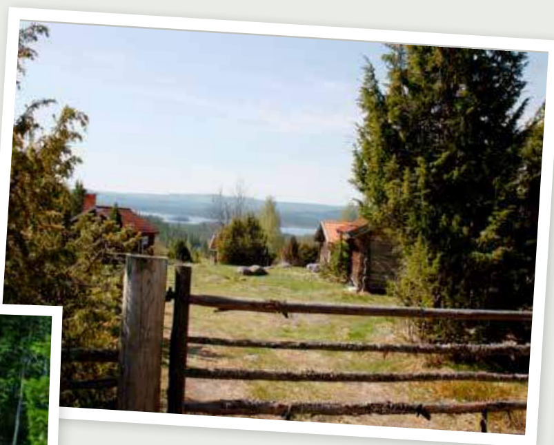
Grind på Grejsans fäbod.